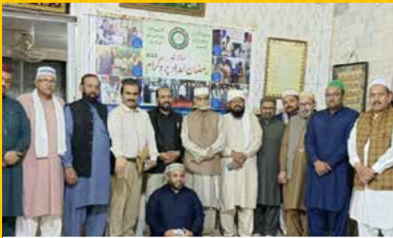
چشتیہ ویلفیئر سوسائٹی ممبران و دیگر مہمانان گرامی سالانہ رمضان امداد پروگرام تقریب میں شریک ہیں۔