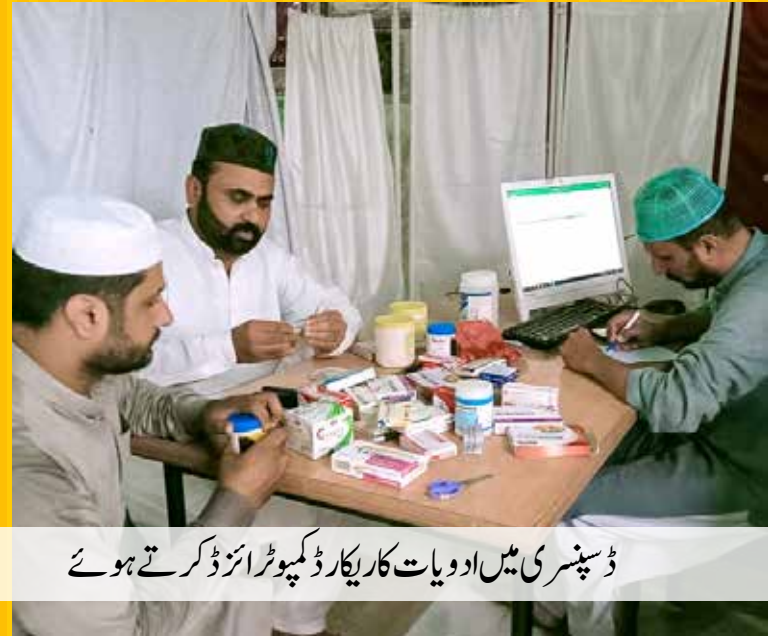
ڈسپنسری میں ادویات کا ریکارڈ کمپیوٹرائزڈ کرتے ہوئے