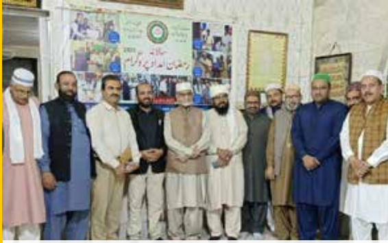
چشتیہ ویلفیئر سوسائٹی ممبران و دیگر مہمانان گرامی سالانہ رمضان امداد پروگرام تقریب میں شریک ہیں۔