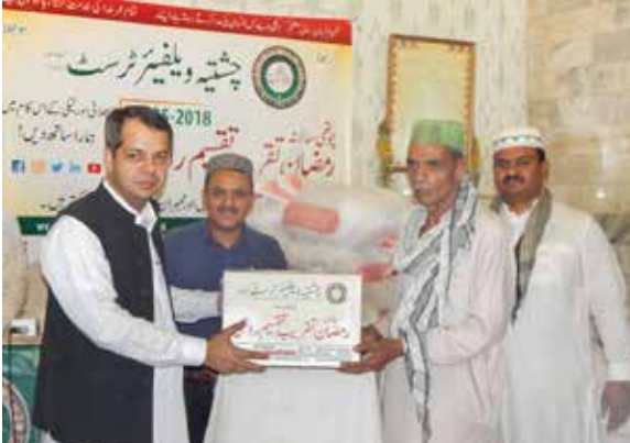
چشتیہ ویلفیئر سوسائٹی کی جانب سے سالانہ رمضان راشن تقسیم تقریب میں ڈپٹی کمشنر لاہور سمیر احمد سید صاحب حقدار افراد میں راشن تقسیم کر رہے ہیں۔